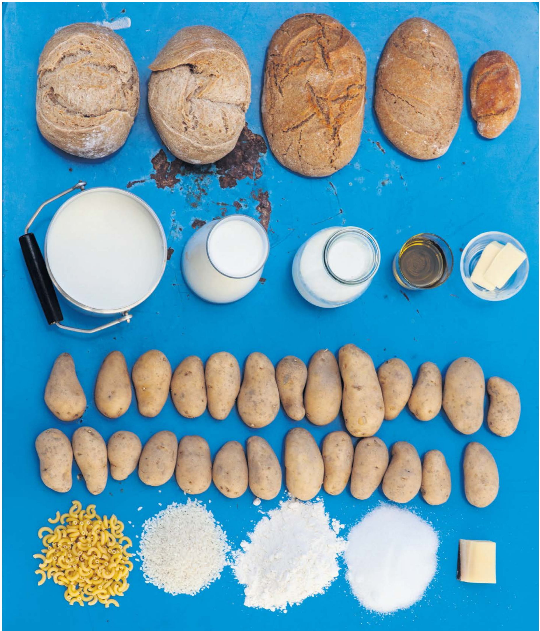
Das also muss jetzt für eine ganze Woche reichen: 1,575 kg Brot; 3,5l Milch; 100 g Öl oder Fett; 37 g Butter; 2,25 kg Kartoffeln; 62 g Teigwaren; 75 g Reis; 83 g Mehl; 125 g Zucker; 62 g Käse.