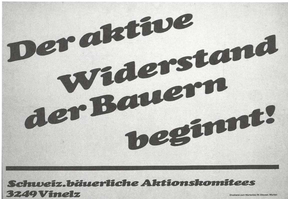
Abb. 5: Kaum beachtet, weil nicht erwartet. Plakat der bäuerlichen Aktionskomitees im Mai 1968.

lichen Bevölkerung als «Bauernstand» in der Historiografie dazu bei, Akteure, Zielsetzungen und Methoden bäuerlich-agrarischer Proteste zu ignorieren. Die von Repräsentanten der verbandlich-politisch organisierten Bauernschaft kreierte Rede vom «Bauernstand» in Industriegesellschaften ist, allerdings pejorativ gewendet, von den Sozialwissenschaften und der Historiografie weitgehend übernommen worden. Sie eignet sich jedoch nicht als Analysekategorie, weil mit ihr weder die ökonomische Eigenart der Bauern als Eigentümer ihres Bodens noch die soziale Vielfalt der bäuerlichen Bevölkerung erfasst werden können. Auf den Umstand, dass Bäuerinnen und Bauern kein Stand im historischen und keine Klasse im modernen Sinne darstellen, verweist die erneuerte Agrargeschichtsschreibung schon seit einem Vierteljahrhundert. 43 Konzentrierte sich diese seither eher auf die Herausbildung unterschiedlicher Landwirtschaftsstile, den weitgehend in institutionellen Bahnen