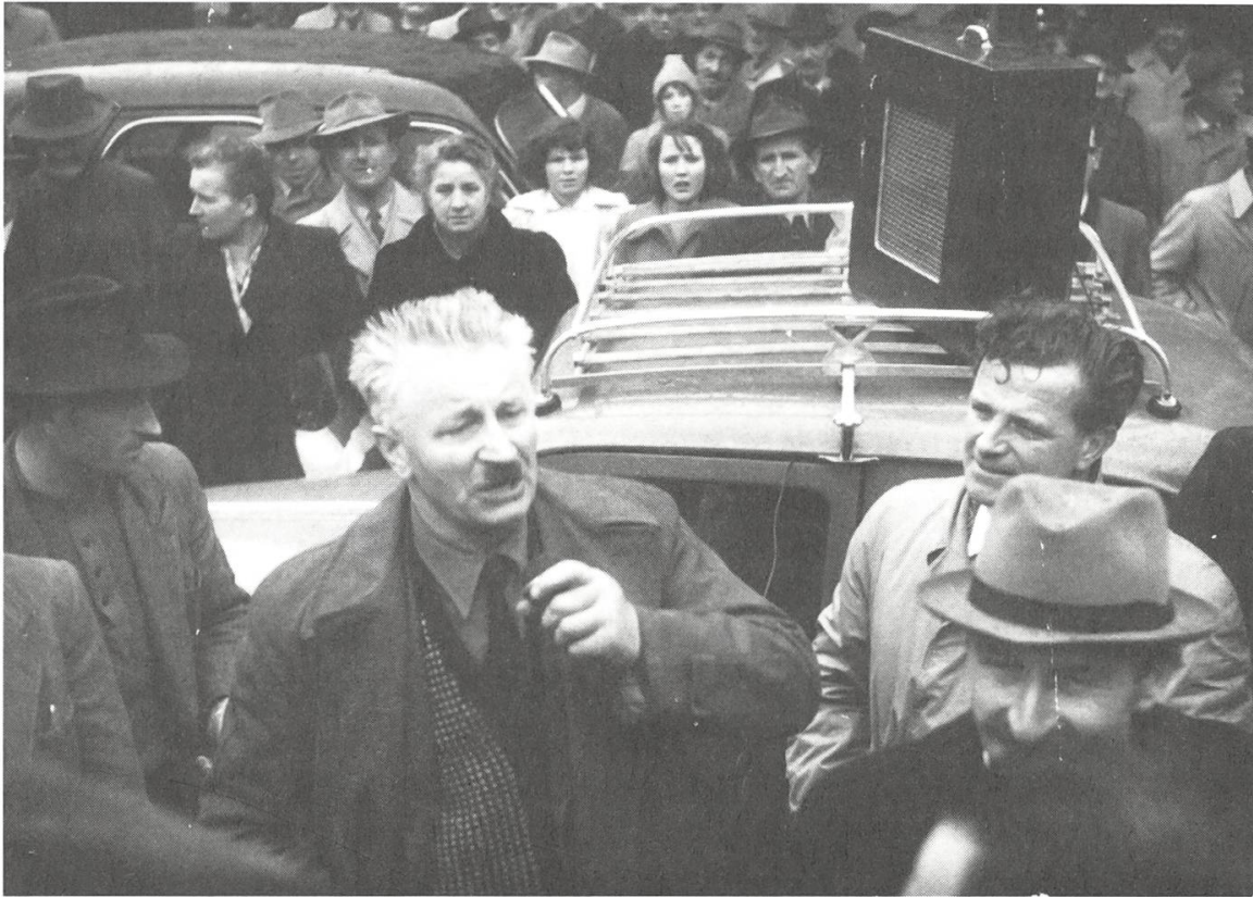
Abb. 3: In der Romandie protestierten Bauern und Bäuerinnen 1945 auch gegen das Verhalten der eigenen, in komplexe Marktordnungen eingebundenen Milchverbände.

Exporteuren und Konsumierenden ausgehandelte privatrechtliche Regelung wurde im Ersten Weltkrieg durch die staatlichen Eingriffe zur Produktions- und Konsumlenkung überlagert und mit der Gründung der für den Export zuständigen Schweizerischen Käseunion institutionell gefestigt. 25