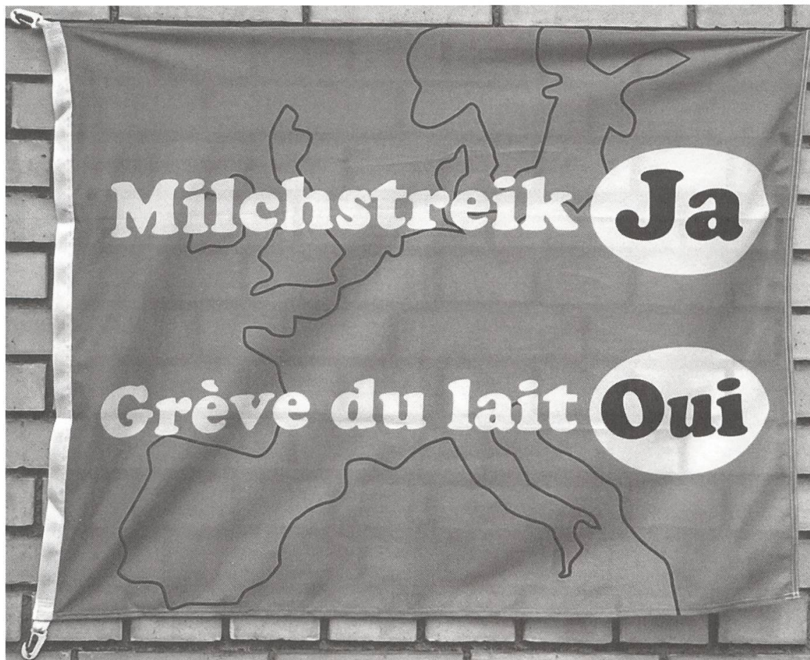
Abb. 4: Auch in neuen Marktordnungen entstehen immer wieder Konflikte: Aufruf bäuerlicher Organisationen in der Schweiz zum europaweiten Milchstreik im Herbst 2008.

eine Rückkehr zu den im Ersten Weltkrieg aufgehobenen Hauslieferungen der Milch verlangten, stellte sich, der Logik der neu etablierten Ordnung folgend, der dem Verband Schweizerischer Konsumvereine (VSK) angehörende lokale Konsumverein denn auch nicht auf die Seite seiner Mitglieder, der Hausfrauen, sondern unterstützte die Konkurrenz, den privaten Milchhandel, indem er sich ebenso wie dieser weigerte, die Hauslieferungen ohne spezielle Abgeltung wieder aufzunehmen. Ihren Mitgliedern gegenüber gleich kompromisslos verhielten sich die Verbände der Milchproduzenten in der zweiten Hälfte der 1940er-Jahre, als Bauern in der Romandie mit einem Lieferboykott einen die Kosten ihrer Produktion deckenden Milchpreis erzwingen wollten. Dass diese Bestrebungen scheiterten, lag dann auch primär am Verhalten der Milchverbände, die die Molkereien in Genf und Lausanne zur Sicherstellung der Versorgung mit Milch aus der Deutschschweiz belieferten.