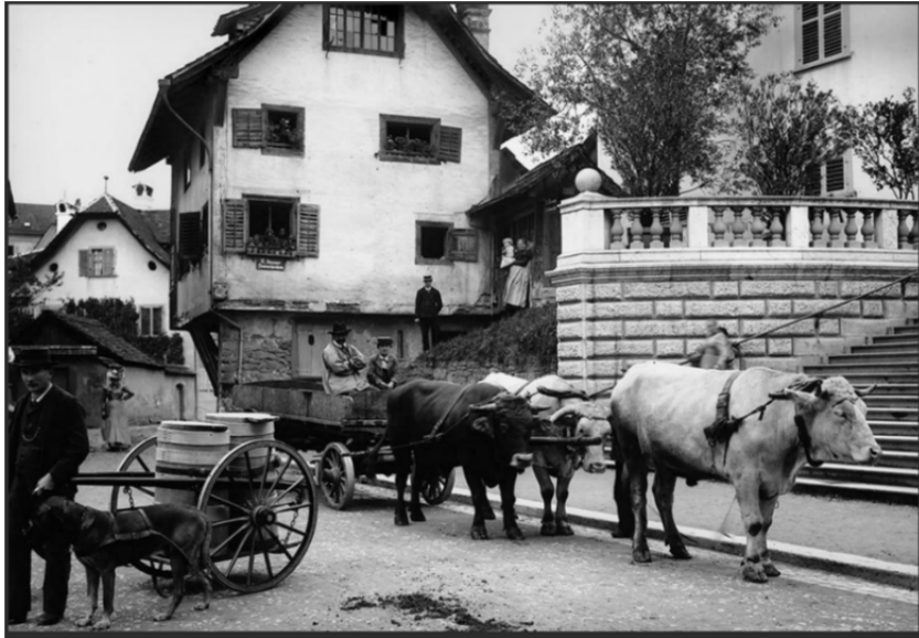
Foto 2. Die Arbeitstiere waren in den Siedlungen und in den Städten allgegenwärtig. Zugtiere waren dabei nicht nur Pferde, sondern auch Rinder und Hunde. (Foto Arthur Wehrli, Schweizerische Nationalbibliothek, Eidgenössisches Archiv für Denkmalpflege; HLS, Artikel: Rind)