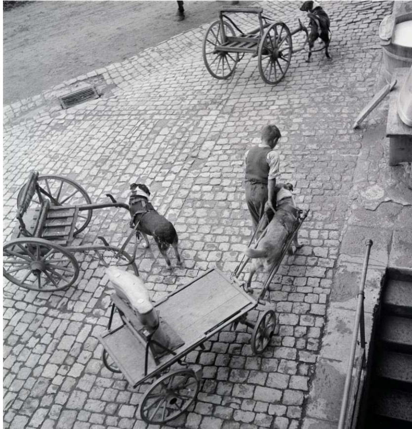
Foto 1. Milchlieferungen zur Käserei in Eggiwil im Emmental. Die Foto zeigt die häufigste Konstellation der Zughundearbeit: die Kleintransporte innerhalb der Hofwirtschaft und in deren lokalen Marktbezügen. Im Bild sind Zweiradkarren und Vierradwagen. Dabei handelte es sich um zwei Prinzipien der Verwendung von Zughunden: als eigentlich kleine Fuhrwerke, in denen die Zughunde allein zogen im Falle des vierrädrigen Wagens, und als Zugtiere, die am Handwagen mitzogen. Letztere Art verweist wohl auch auf den Umstand, wie sich die Hundearbeit am verbreitetsten entwickelte: als eine Unterstützung in Kleintransporten, die sonst Menschen, häufig auch Frauen und Kindern oblagen. Die meisten gesetzlichen Regelungen favorisierten das Mitziehen der Hunde. Zahlreiche Bild- und Filmquellen belegen die Arbeit von Kindern mit Arbeitstieren und im Besonderen mit Hunden; sie dokumentieren nicht selten ein enges, beide Seiten ermächtigendes Verhältnis.