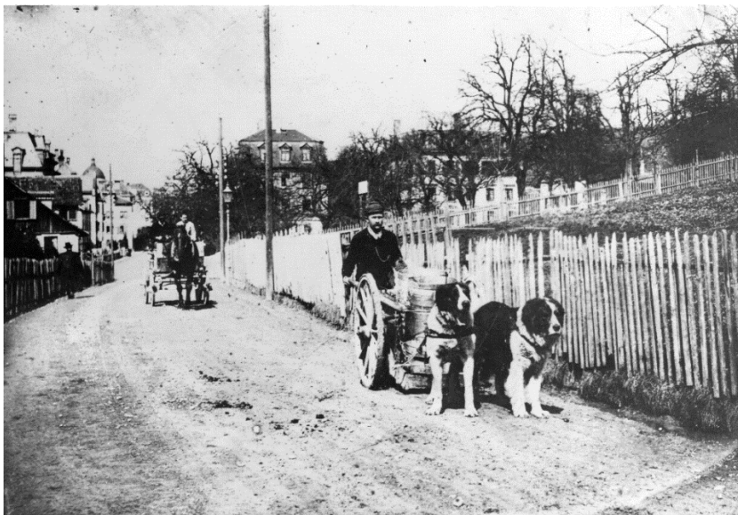
Foto 3. Hundekarren und Pferdefuhrwerk auf der Witikonerstrasse in Hirslanden, Zürich. Die beiden Hunde ziehen, während der Milchmann den zweirädrigen Hundewagen in Balance hält und bei Bedarf mitstösst.