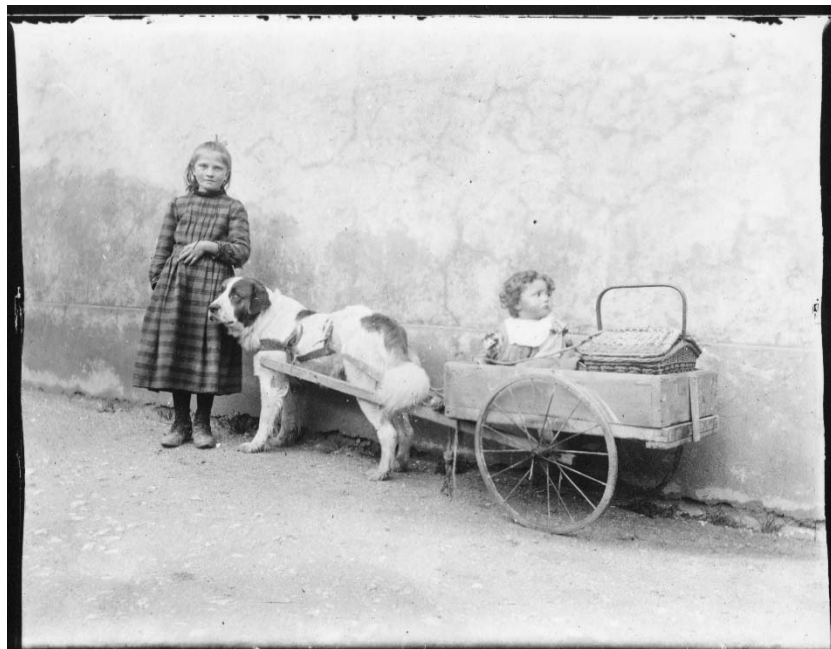
Foto 9. Die Foto der beiden Schwestern mit dem ihnen offensichtlich sehr vertrauten Zughund ist ein berührendes Dokument der Mensch-Tier-Beziehung: Der Hund arbeitet nicht nur, er gehört zur Familie und damit auf das Foto. Es zeigt eine Situation in den jurassischen Freibergen. (Foto, Eugène Cattin, um 1900, Archives cantonales jurassiennes)