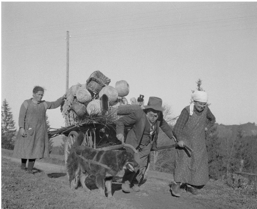
Foto 7. Die um 1930 entstandene Foto zeigt den Hund als Zugtier der «kleinen Leute» im «kleinen Handel». Ein Korber und zwei Korberinnen, wahrscheinlich aus Rüscheegg im Kanton Bern, bringen ihre Ware mit einem zweirädrigen Handwagen auf den Markt oder direkt in die Höfe und Haushalte. Der Hund zieht mit. Er ist in einem Brustblatt- oder Sielengeschirr angespannt.