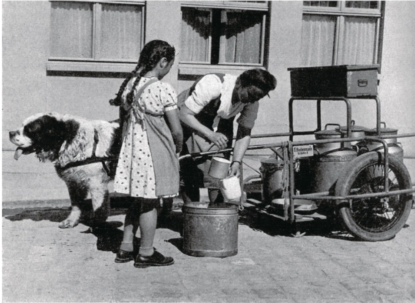
Foto 6. Eine sogenannte Selbstausmesserin in St. Gallen liefert die auf dem eigenen Landwirtschaftsbetrieb produzierte Milch an die Haustüre der städtischen Konsumentenschaft. Auch hier handelt es sich um eine selbständige Erwerbstätigkeit von Frauen, die ohne die Zugarbeit von Hunden und die Mithilfe von Kindern nicht hätte erbracht werden können.