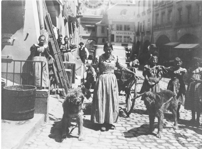
Foto 4. Junge Milchfrau mit Handkarren zum Milchtransport in der Berner Marktgasse beim Zytgloggeturm. Vor den Karren eingespannt sind zwei mit einem Maulkorb versehene Hunde. Die Fotografie entstand im Jahr 1909.