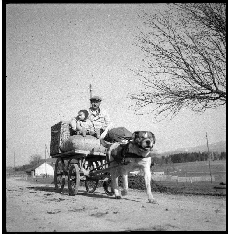
Foto 8. Die Foto des vierradrigen, gummibereiften Hundefuhrwerks stammt aus einer im März 1944 realisierten Bildreportage des Fotografen Eugen Thierstein (1919–2011) über die Welt der Heimarbeiterinnen und Heimarbeiter im freiburgischen Corpataux.